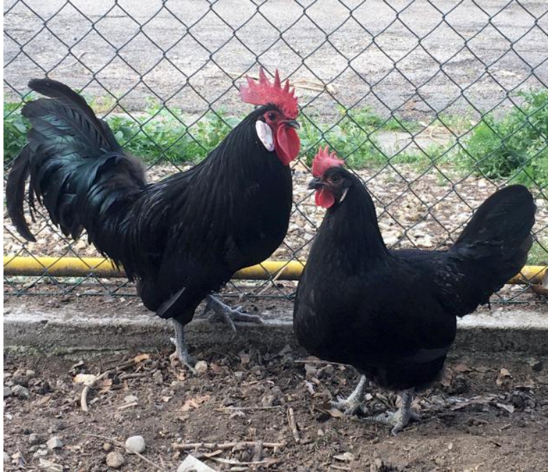
Experimental Animal Farms, UniFI